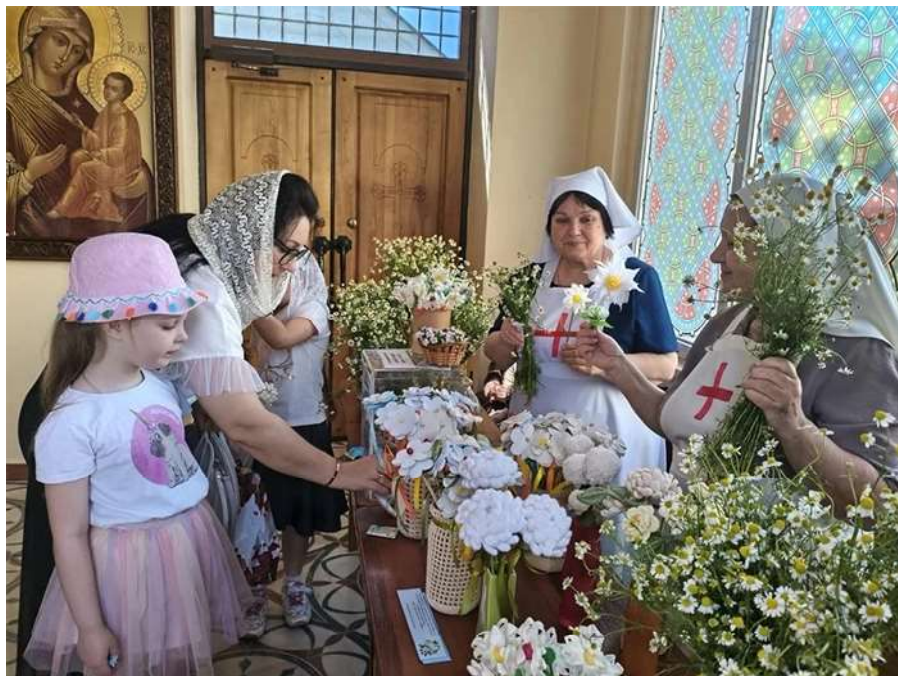
На фото: сестры милосердия сестричества во имя святой блаженной Ксении Петербургской Свято-Троицкого храма во время проведения благотворительной акции «Белый цветок» у себя на приходе.

жение любви и мира в российских семьях, укрепление традиционных семейных ценностей, поддержка традиции многодетности и приобщение семей к добрым делам.