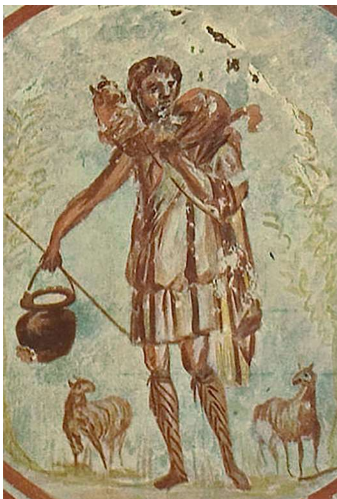
Добрый Пастырь, 3-й век, Катакомбы Рима