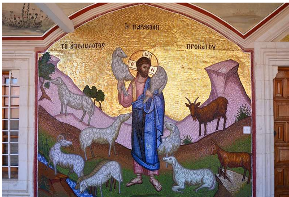
Добрый Пастырь, Монастырь Кикской иконы Божией Матери, Никосия, Кипр

В еврейском предании также можно найти осмысление образа пастыря народа.