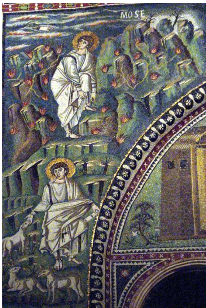
Моисей пасет стада Иофора и Неопалимая Купина. Мозаика. VI в. Базилика Сан-Витале, Равенна

Существование данного образа можно найти уже в одном из древнейших литературных произведений, а как утверждают некоторые исследователи – самом древнем памятнике литературы в истории человечества - Эпосе о Гильгамеше или Сказании «О все выдавшем», герой которого правил в шумерском городе-государстве Уруке около 5 тысяч лет назад.